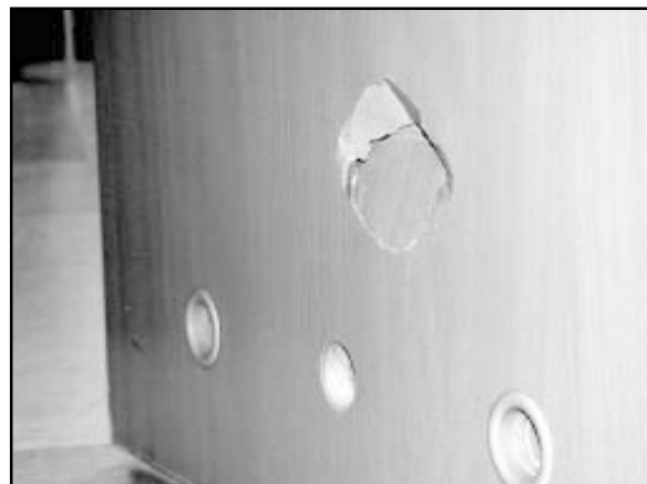
Dziura w drzwiach