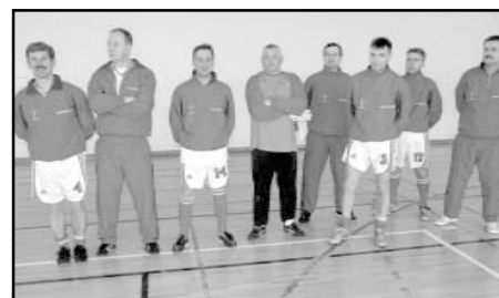
Soncas - zwycięska drużyna